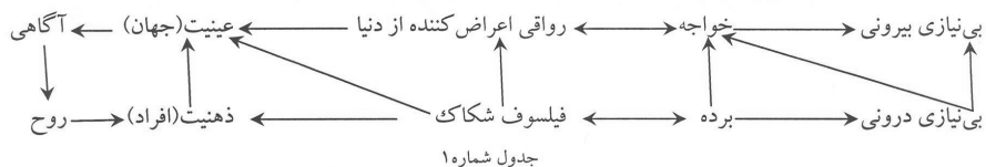
جدول شماره ۱

از آنچه به بیان آمد هویدا می‌گردد که هگل در پدیدارشناسی از فرودست‌ترین ساحت آگاهی انسان آغاز می‌کند و دیالکتیکانه بالا می‌رود تا به ساحتی برسد که در آن، ذهن بشری به دیدگاه مطلق دست می‌یابد و بستری می‌شود برای روح خود آگاه بیکران و این همان آزادی انضمامی یا حقیقی است که هگل در مقابل آزادی انتزاعی رواقی بر آن پای می‌فشارد. به نظر وی، برخلاف موضع فیلسوف رواقی، آزادی با گریز از زندگی و به ظاهر خوار شمردن آن حاصل نمی‌شود، بلکه در درون زندگی و با کسب خرسندی از آن تحقق می‌یابد. و اینجاست که عقل و درایت و فضیلت رواقی به زودی رنگ می‌بازد و در نهایت کسالت بار خواهد شد.